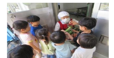
すみれ組（3歳児） 担任

と必死に考えて考えて…そうして一生懸命に皮を剥き実が出てくると「できたよ〜！」と満面の笑みの子ども達でした。普段は調理されている状態で見ることが多い野菜。本来の姿を見て自分たちで洗ったり皮をむいたりして翌日の給食として提供された時は「これお手伝いで洗ったお野菜やなあ。」とお味も格別だったようです。