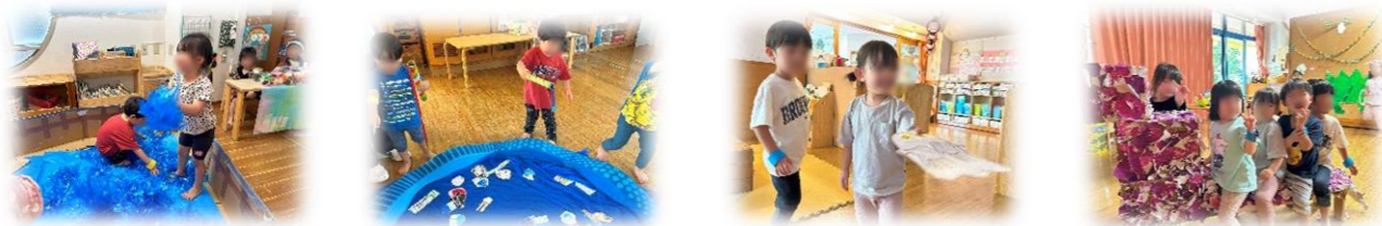
ひこうきグループ（3歳児） 担任

6月12日にわくわくパーティーがありました。子どもたちは朝からわくわくドキドキ、待ちきれない様子でした。2歳はおばけさがしゲーム、3歳はひこうき銭湯、4歳は恐竜の世界、5歳はロボットカミィのお店屋さんとして盛り沢山でした。乳児クラスは色んなコーナーを順番に回って、のんびり楽しんでいました。幼児クラスは店番をする時、「いらっしゃいませ〜」「ありがとうございました」と元気な声を響きわたらせ、小さなお客さんにとても優しく教えてあげる姿が見られました。異年齢交流の良さを感じられる賑やかな1日となりました。