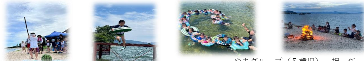
やまグループ（5歳児） 担任

初めての場所で大好きな友だちと過ごした2日間。大切にかけがえのない思い出になりました！